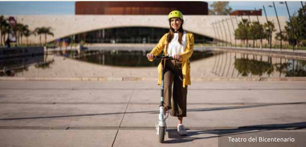
Teatro del Bicentenario