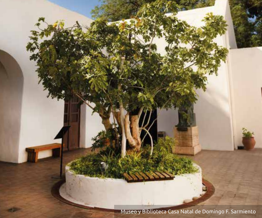
Museo y Biblioteca Casa Natal de Domingo F. Sarmiento